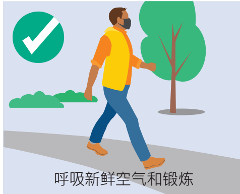
呼吸新鲜空气和锻炼