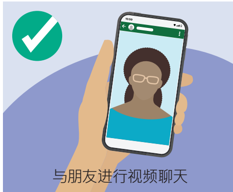
与朋友进行视频聊天