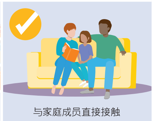
与家庭成员直接接触