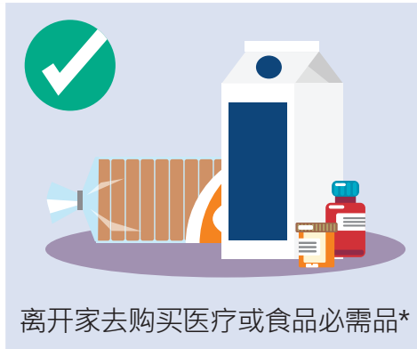
离开家去购买医疗或食品必需品*