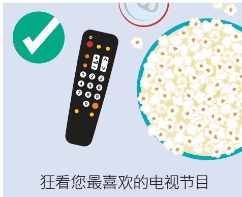
狂看您最喜欢的电视节目